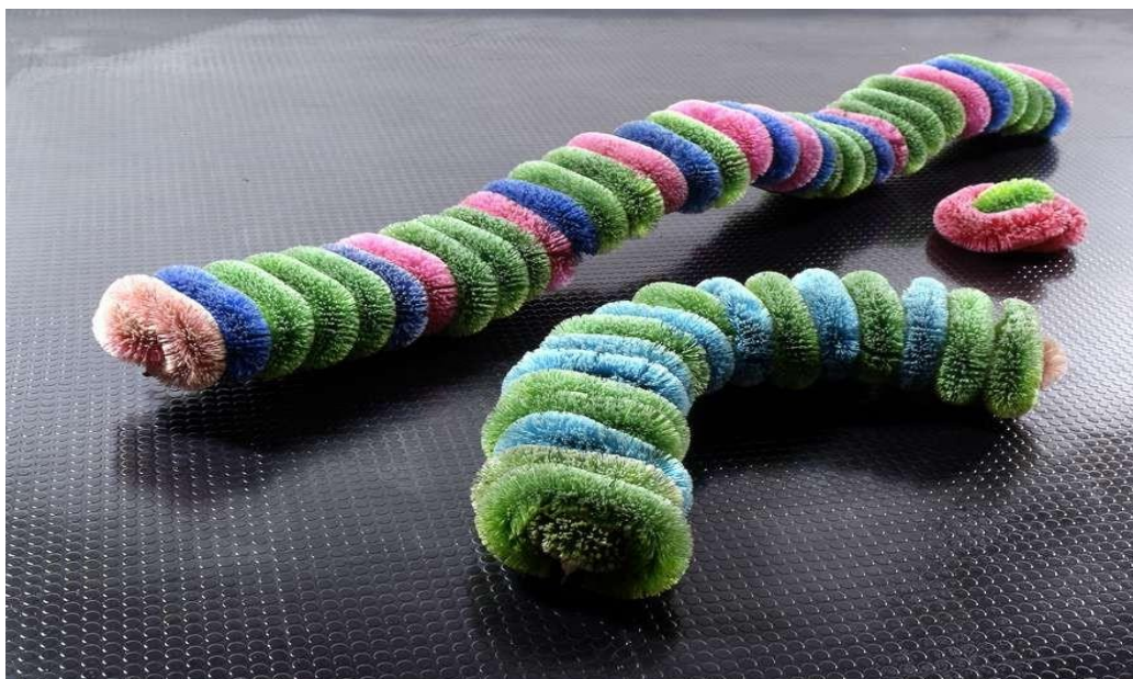
Pino Pascali, Bachi da setola , 1968, scultura (scovoli di materiale acrilico con sostegno metallico di lunghezza)