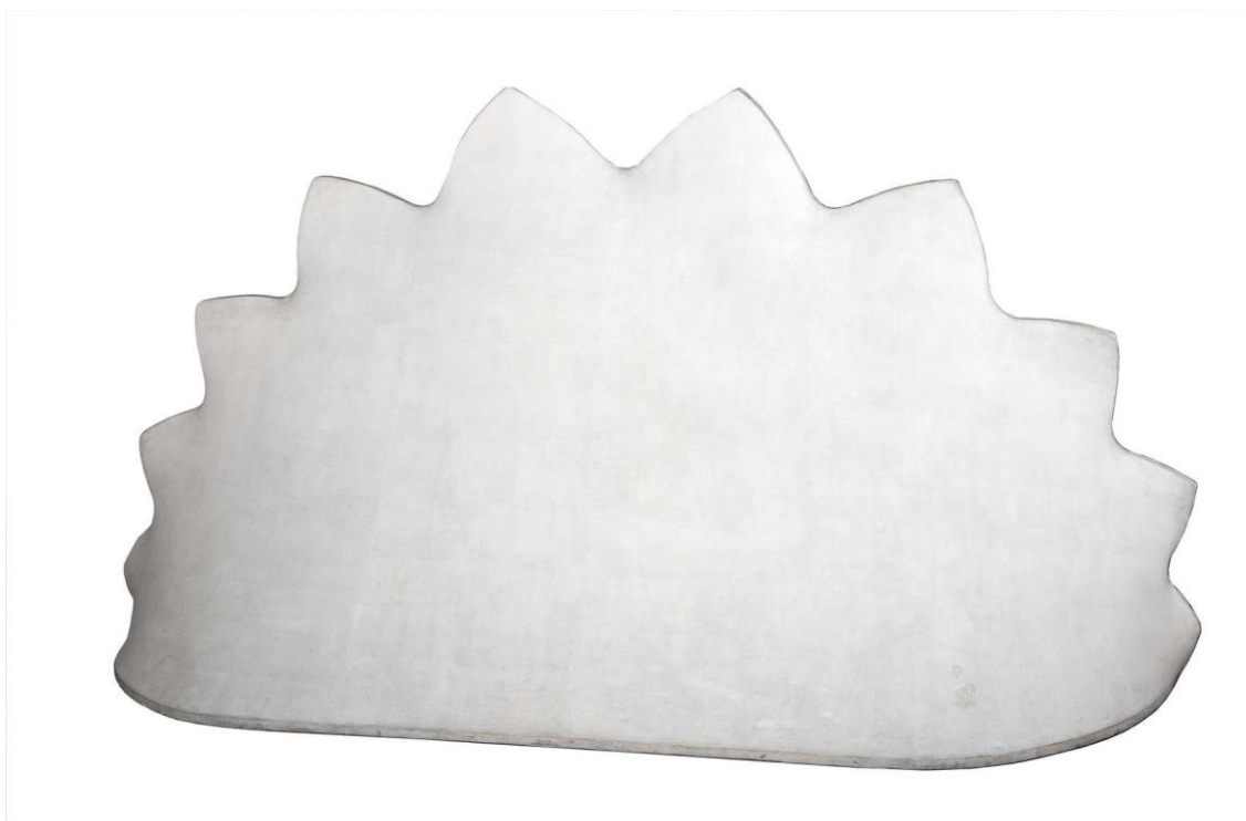
Pino Pascali, Il dinosauro riposa , 1966, scultura (tela grezza centinata trattata con caolino)