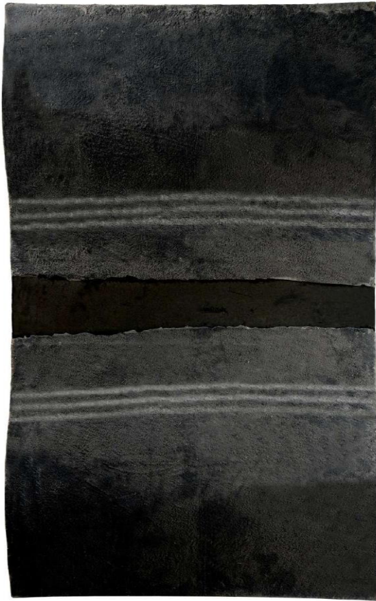
Pino Pascali, Senzatitolo , 1964, scultura (feltro nero e smalto su struttura di legno centinato)