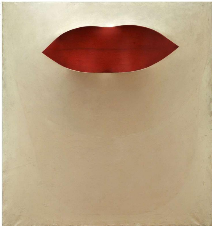
Pino Pascali, Primo piano labbra , 1965, scultura (tela smaltata tensionata su struttura lignee con camera d'aria)