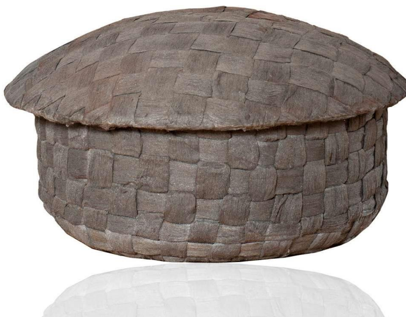
Pino Pascali, Cesto , 1968, scultura (lana di acciaio intrecciata su struttura di fibrocemento)