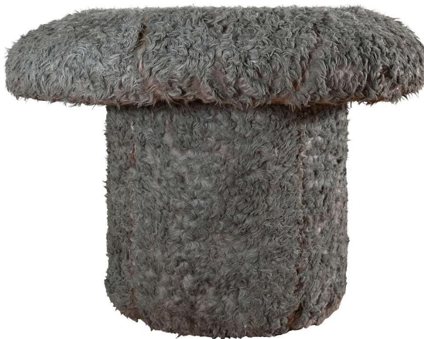
Pino Pascali, Contropelo , 1968, scultura (pelo acrilico su struttura di fibrocemento)