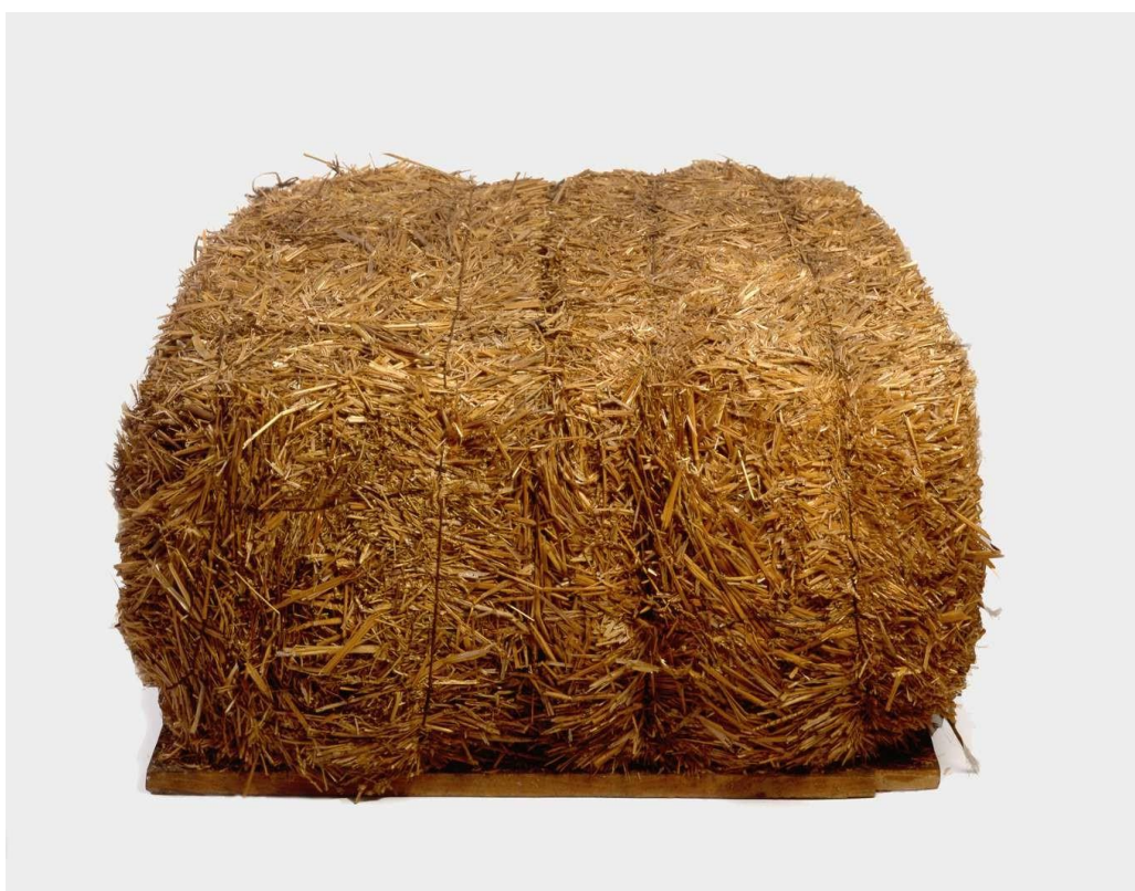
Pino Pascali, Balla di fieno , 1967, scultura (paglia su tavola di legno e fil di ferro)