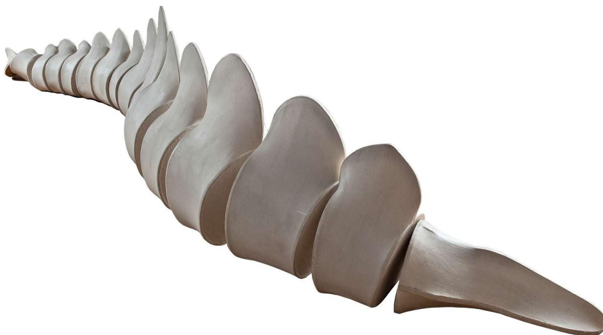
Pino Pascali, Ricostruzione del dinosauro , 1966, scultura (tela grezza con vinavil e caolino tesa su centine di legno)