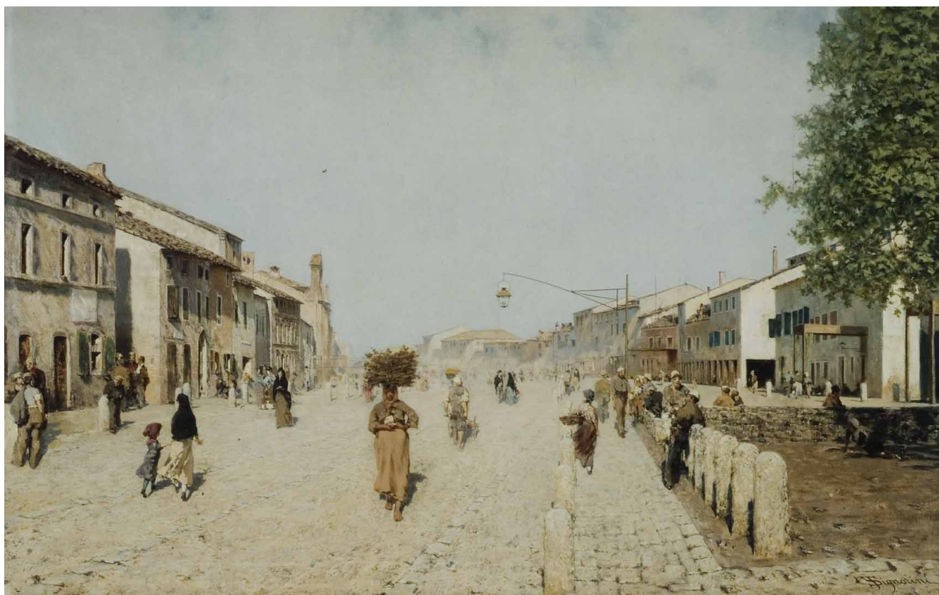
Telemaco Signorini, Sobborgo di Porta Adriana a Ravenna

Cammineremo tra piazze e strade che prendono vita nelle opere degli artisti e costruiremo la nostra città ideale sperimentando con le tecniche, come veri architetti del futuro.