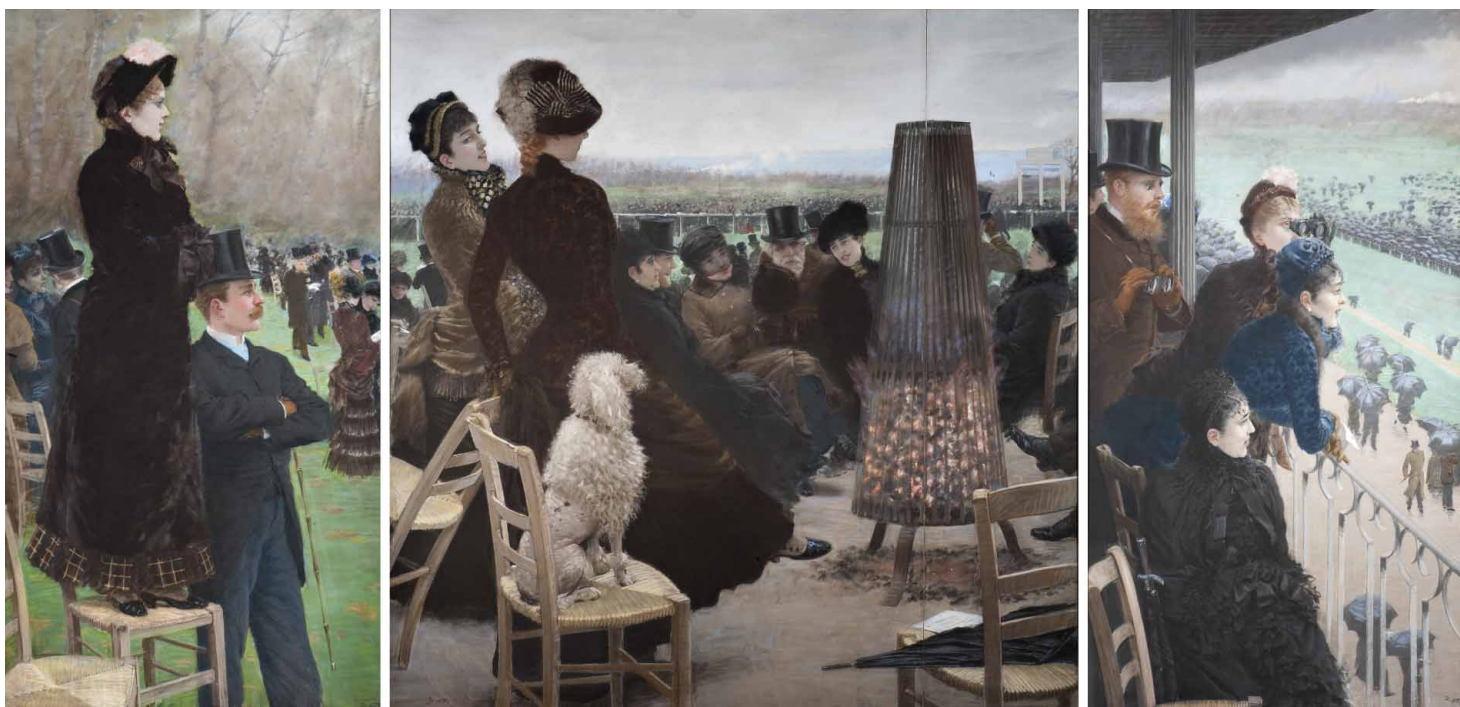
Giuseppe De Nittis, Le corse al Bois de Boulogne

Viaggeremo con lo sguardo attraverso mappe, città lontane e luoghi immaginari, esplorando spazi reali e fantastici: pronti a cambiare rotta?