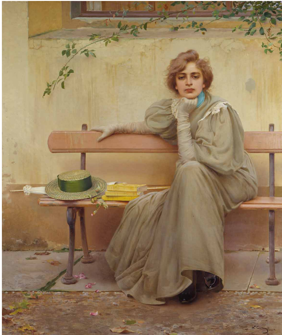
Vittorio Corcos, Sogni

Osservando volti, gesti e colori nelle opere, indagheremo lo spazio più profondo di ciascuno di noi e le emozioni